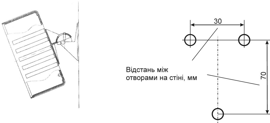
Рис. 1. Кріплення гучномовця для варіанту комплектності постачання а)